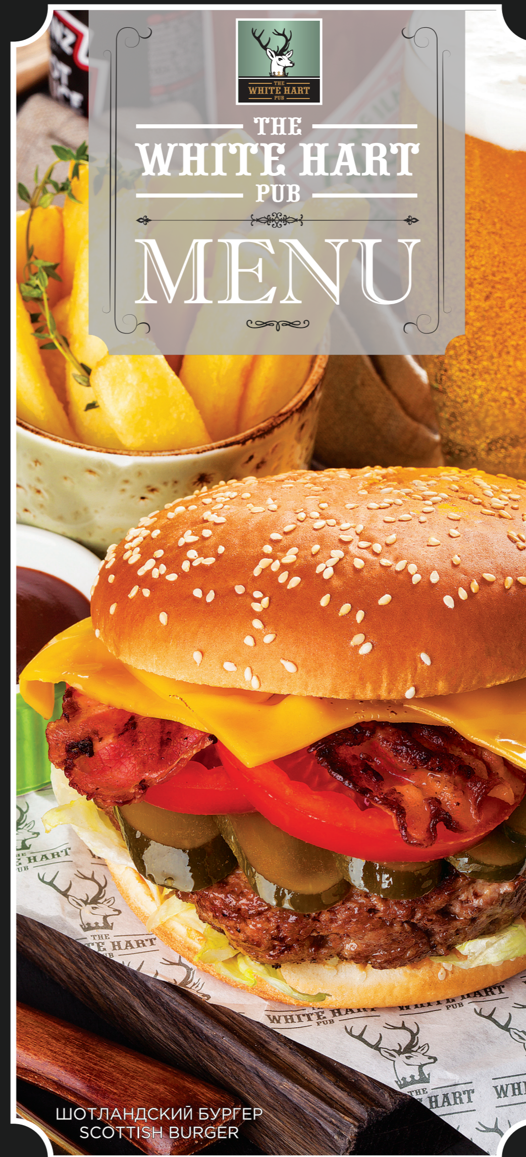
ШОТЛАНДСКИЙ БУРГЕР SCOTTISH BURGER

This printed booklet is for advertise purpose. Please ask the manager for detailed menu. All prices are given in rubles, VAT included. We accept rubles only and main cards.